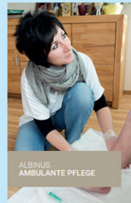
ALBINUS AMBULANTE PFLEGE