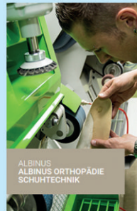
ALBINUS ALBINUS ORTHOPÄDIE SCHUHTECHNIK